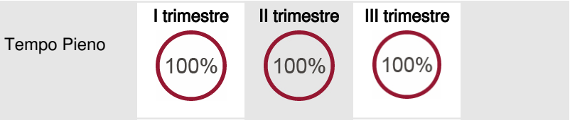
Distribuzione per Qualifica (Dati in percentuale rilevati al 30/09/2024)